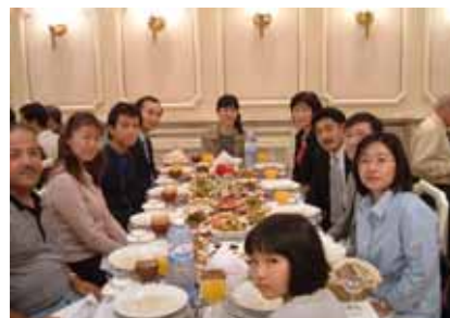
事務所員、家族でイフタル 大砲の音が鳴ったら食事をスタート

皆さんもこの企画を参考に、イスラムの最も特別な月「ラマダン」を知ってもらえれば幸いです。