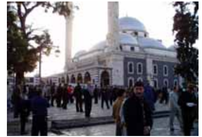
大祭礼日の日の出の礼拝の様子

気になる様子。「人は弱きもの」とされているクルアーンの教え通りに実践しているシリア人を見て、これはこれで人間臭さを垣間見ることが出来た。だから宗教ってものが気になるわけだ。