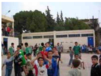
試合を見に来た子供たち

ラマダン中は授業時間が短縮され、通常よりも一時間ほど早い終業時間を迎えます。そこで、ハマのパレスチナ人地区ではこの時間を利用して、若さ漲る中学生から貫禄ある60歳代の老夫までもが参加する老若混合サッカー大会が開催されました。大会は連日、終業の鐘がなるのが先か、見学者がグラウンドに押し寄せるのが先かわからないほどの盛り上がりを見せました。