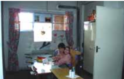
アイド(ラマダン明け休暇)直前

まずは自分でも体験をと思いましたが、いきなりの断食は体に悪いので、体慣らしに減食からスタートです。朝は夜明け前に食べ、活動から帰って少量を食べ、日没後にいつもどおりの夕食をとるようにしました。そうしたらなんと! わずか10日足らずで、体重が3kgも減ってしまったのです。うっ、嬉しい~(涙)が、しかし! 急な減量はリバウンドのもと。かくして私の「なんちゃってラマダン」は、あえなく2週間足らずで中断となりました。