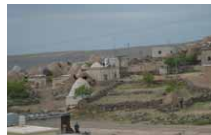
伝統的な家が残る村、ジャバラル・ハス

私の目下の心配は、前述のレストランがラマダーンの後もうるさいのではないかとということ・・・。このまま私も一緒に睡眠不足になっていきそうな予感がします。