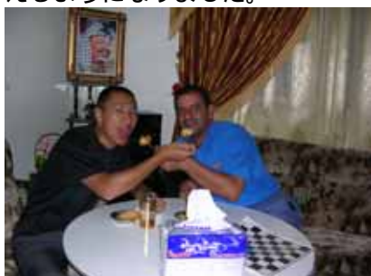
食後のデザートを頂く

た。不思議なことに、活動外の時間を生徒たちと共有したことでそれまで悩みもちっぽけなものに思えるようになりました。