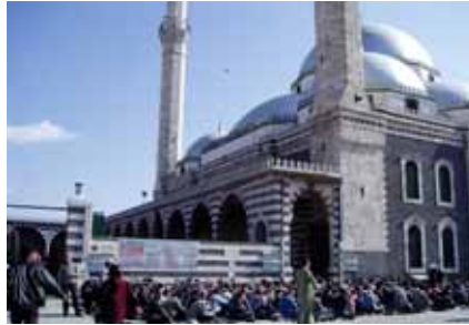
金曜礼拝に集まったホムスの人達

最終週の金曜日の公式礼拝での様子を見た。人々の宗教心がラマダンの中で最も高くなると聞いていたからだ。場所はホムスの有名なKhaled Ibn al Waleed Mosque。礼拝堂に入れない人々は礼拝堂からあふれ、イマーム（導師）のありがたい説教を人々は外にしかれたゴザに座って頭を垂れて聞いている。なるほど確かに人々は集団礼拝を良しとし、多くの人々が神に祈りを捧げている。