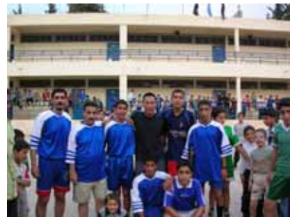
UNRWA ハマ教員生徒混合チーム

いだけのものではないということ学びました。この一ヶ月、情報誌には載っていないシリアをおなかいっぱい味わうことができました。