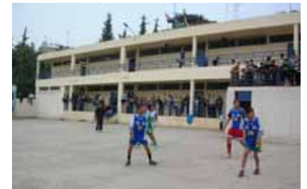
支援経費で作成したピブスが大活躍

魚のように元気になります。驚いたことに学校を休んでいた生徒までもが寝巻きのような格好のまま、試合を見にやってくるのです。