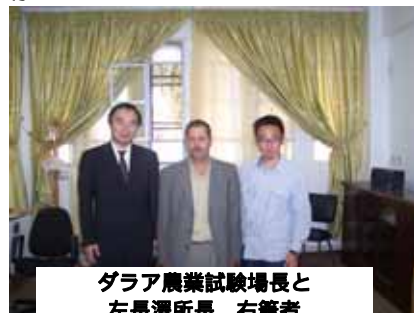
ダラー農業試験場長と 左長澤所長、右筆者

・・・それにしてもラマダンをしてシリア人に怒られた日本人は私くらいなのではないでしょうか??